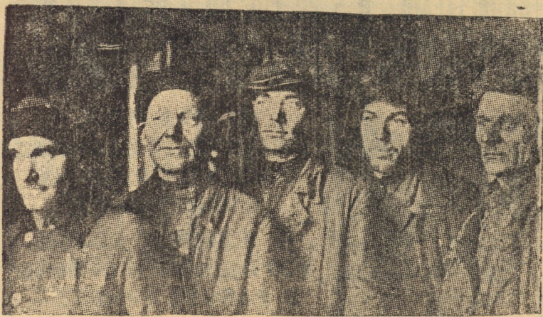
Ударники вагонного цеха.